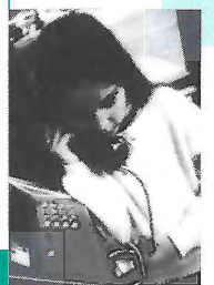
Schirmherrin Doris Schröder-Köpf

Bundesarbeitsgemeinschaft Kinder- und Jugendtelefon e.V.